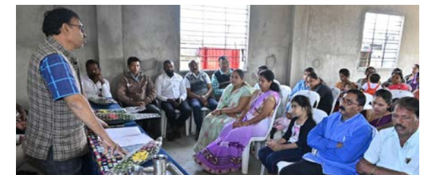
प्रत्येक घटकाने सजग व निर्भोड पणे पुढे येण्याचे आवाहन केले. यावेळी बोलतांना परिषदेचे वरिष्ठ पदाधिकारी यांनी सांगितले की, "भ्रष्टाचार हा समाजाचा कणा मोडणारा प्रकार असून, त्याचे निर्मूलन करण्यासाठी जनजागृती व संघटीत प्रयत्न आवश्यक आहेत." स्नेहमिलन कार्यक्रमाच्या माध्यमातून परीषदेचे कार्यकर्ते, सामाजिक कार्यकर्ते व नागरिक यांच्यात आपुलकिका संवाद साधत

नागपूर : भ्रष्टाचार मुक्त समाज निर्मिती, नागरिकांमध्ये कायदेशीर जागृती व प्रशासनातील पारदर्शिता वाढविण्याच्या उद्देशाने भारतीय भ्रष्टाचार निर्मूलन परिषदेच्या वतीने भ्रष्टाचार निर्मूलन मार्गदर्शन व स्नेहमिलन कार्यक्रम यशस्वीरित्या मोठ्या उत्साहात पार पडला. या कार्यक्रमात भ्रष्टाचार विरोधात जनजागृती अभियानचे स्टीकर चे विमोचन करण, भ्रष्टाचाराशी संबंधित, कायदे, तक्रार नोंदविण्याची प्रक्रिया, नागरिकांचे हक्क, कर्तव्ये तसेच भ्रष्टाचार विरोधात लढा कसा उभा करावा याबाबत सर्वोत्तर मार्गदर्शन करण्यात आले. परिषदेच्या पदाधिकाऱ्यांनी भ्रष्टाचार निर्मूलनासाठी सामाजिक