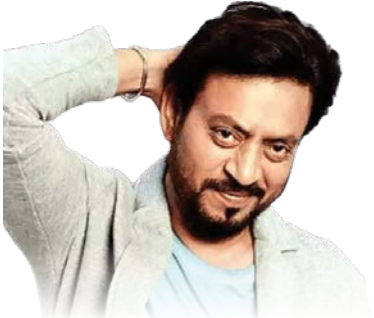
इरफान खान यांची शेवटची लढाई.. (पान ७ वर)