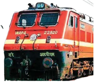
अमरावतीच्या प्रवाशांना तिकीट दरवाढीचा फटका नाही (पान ८ वर)

नागपूर, अमरावती, चंद्रपूर, गडचिरोली, भंडारा, गोंदिया, वर्धा, यवतमाळ, अकोला, वाशीम, बुलडाणा, नांदेड, हिंगोली, परभणी, लातूर, धाराशिव, अहिल्यानगर, छ. संभाजीनगर, बीड, जालना, नंदुरबार, धुळे, नाशिक