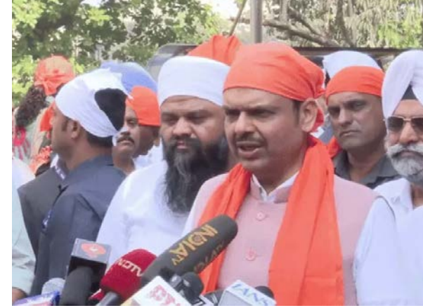
विरोधकांकडून होणाऱ्या घोषणा या केवळ संभ्रम निर्माण करण्यासाठी असल्याचा टोला त्यांनी लगावला.

त्यांनी व्यक्त केला. देशावर प्रेम करणारे, राष्ट्रनिष्ठ आणि विचारांशी प्रामाणिक असलेले नागरिक हे सर्व बाराकडिने पाहत असल्याचे सांगत, या प्रकारच्या राजकारणाची किंमत संबंधितांना मोजवाय लागेल, असा इशारा त्यांनी दिला. ठाकरे बंधूंच्या युतीवर टीका करताना फडणवीस यांनी महायुतीबाबतही आपली भूमिका स्पष्ट केली. महायुतीची घोषणा करण्याची आम्हाला कोणतीही घाई नाही किंवा आवश्यकता नाही, असे ते म्हणाले. आम्ही आधीपासूनच एकत्र आहोत आणि आमच्यात कोणताही संभ्रम नाही, असा दावा त्यांनी केला.