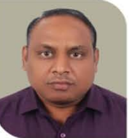
विशेष उपस्थिती मा. मनोज भारशंकर (प्रसिद्ध कवी आभूषावी, पुणे ई.)