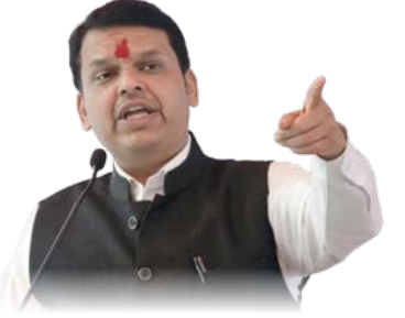
जोडे चाटून मते मागण्याचे उद्भव ठाकरेचे राजकारण (पान ६ वर)