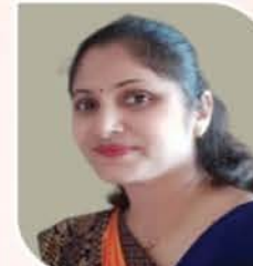
तृतीय विजेता कथा - तिच्या डोळ्यातील आभाळ कथाकार पूनम वानकर, हिंगणघाट