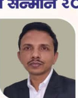
मा. लीलाधर दवडे आजनी