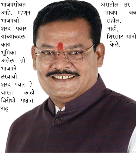
भाजपसोबत आहे. म्हणून भाजपची शरद पवार यांच्याबद्दल काय भूमिका असेल ती भाजपने ठरवावी. शरद पवार हे जास्त काही विरोधी पक्षात राहू