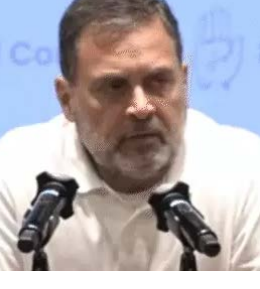
दावण्यासाठी आहे. जेव्हा भारत जगातील चौथी अर्थव्यवस्था बनला आहे, त्यांच्या म्हणण्यानुसार, तर मनरेगासारखी योजना बंद केली? तुमच्याकडे इतका पैसा आहे तर (तुम्ही) देशाला का लुटत आहात? अंबानी-अदानी देशाचा पैसा बुडवत आहेत, तर मजुरांना

परिस्थितीत मनरेगाचे रक्षण करेल. कामगारांच्या हक्कांसाठी आम्ही संघर्ष करू. केंद्र सरकारने कोणत्याही सल्ल्याशिवाय मनरेगा रद्द केले. मनरेगामधून राष्ट्रपिता गांधींचे नाव काढणे हा त्यांचा अपमान आहे. कारण सोनिया गांधी, मनमोहनजी यांनी मनरेगाला कायद्याचे स्वरूप दिले होते. आम्ही हक्क दिला. तुम्ही नाव बदलत आहात. तुम्हाला फक्त गांधी कुटुंबच नाही, तर महात्मा गांधींचे नावही आवडत नाही. गांधी आडनावामुळे सरकारला अडचण आहे. हा कायदा गरिबांना चिरडण्यासाठी आणि त्यांना