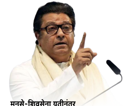
मनसे-शिवसेना युतीनंतर उमेदवार निश्चितीला वेग (पान ५ वर)