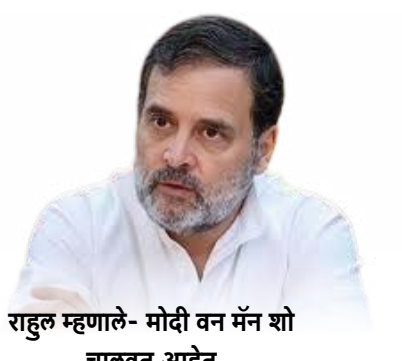
राहुल म्हणाले- मोदी वन मॅन शो चालवत आहेत (पान ५ वर)

अंक : १४४ वा वर्ष : २ रे, मूल्य : ३ रुपये, पृष्ठे : ८