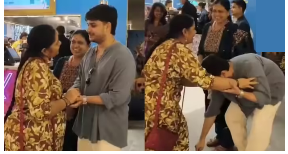
अजून काय हवं?' व्हिडिओवर आशीर्वाद', 'अजून छान चित्रपट केल्या आहेत. नेटकऱ्यांनी, 'हाच खरा मिळूदे या वर्षात' अशा कमेंट्स

व्हिडिओच्या शेवटी अभिनय म्हणतोय की, 'वर्षाचा पहिला दिवस...आमची पहिली थिएटर भेट आणि प्रेक्षकांकडून मिळालेली ही पहिली पावती... प्रेक्षकांकडून मिळालेली पहिली कमाई... बस