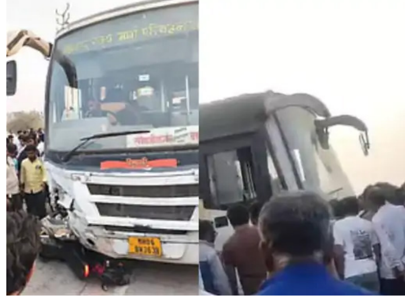
रुग्णालयात नेण्यापूर्वीच त्यांचा मृत्यू झाला होता. या घटनेमुळे परिसरात मोठी शोककळा पसरली असून पोलिस प्रशासनाकडून पुढील तपास केला जात आहे.

मुंबई- रस्ते महामार्गावरील अपघातांचे सत्र थांबण्याचे नाव घेत नसून, बुलढाणा-छत्रपती संभाजीनगर महामार्गावरील धाड गावाजवळ एसटी बस आणि दुचाकीच्या भीषण अपघातात तीन तरुणांचा दुर्दैवी मृत्यू झाला आहे. बस आणि दुचाकीची समोरासमोर जोरदार धडक झाल्याने हा भीषण अपघात घडला, ज्यामध्ये दुचाकीवरील तिन्ही युवकांचा जागीच प्राण गेला. घटनेनंतर स्थानिक नागरिकांनी तातडीने धाव घेत रुग्णवाहिकेला घाबरण केले आणि पोलिसांना माहिती दिली, मात्र दुर्दैवाने जखमींना