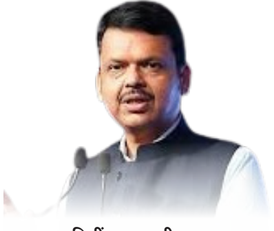
लाडक्या बहिणींना लखपती दीदी बनवणार ... (पान ५ वर)