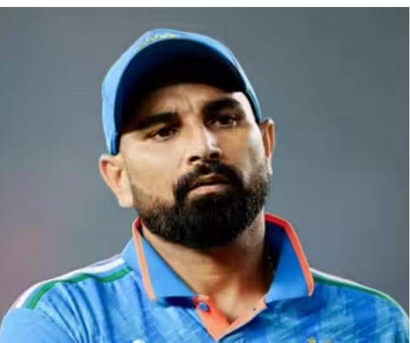
मोहम्मद शमीला आता भारताच्या निवडणूक आयोगाने नोटीस पाठवली आहे आणि

मोहम्मद शमीच्या अडचणीत वाढ होत असल्याचे दिसत आहे. मोहम्मद शमी हा विजय हजारे ट्रॉफी गाजवत आहे. पण तरीही त्याला गौतम गंभीर यांनी भारताच्या संघात स्थान दिले नाही. त्यामुळे मोहम्मद शमीचे करीअर संपल्याचे आता म्हटले जात आहे. कारण जर यावेळी संघात स्थान दिले नाही तर वनडे वर्ल्ड कपसाठी त्याचा विचार केला जाणार नसल्याचे स्पष्ट आहे. त्यामुळे त्याला भारताचा संघ जेव्हा जाहोरा झाला तेव्हा मोठा धक्का बसला होता. तेव्हा शमीचे नाव जोरदार चर्चेत होते. आता पुन्हा एकदा मोहम्मद शमी हा चर्चेत आला आहे. पण आता त्याला भारताच्या निवडणूक आयोगाने थेट नोटीस पाठवली आहे.