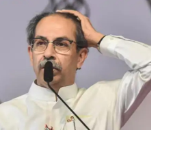
अर्ज मागे घ्यायला लावला असल्याचा आरोप केला जात आहे. कल्याण डोंबिवली महापालिकेच्या निवडणुकीच्या पार्श्वभूमीवर शिवसेना ठाकरे गटाच्या उमेदवारांनी स्वतःच्याच पक्षाच्या जिल्हाप्रमुखांवर गंभीर आरोप केला आहे. जिल्हाप्रमुखांनीच अर्ज मागे घ्यायला लावले, असा आरोप उमेदवाराने केला आहे. या संदर्भात एक ऑडिओ क्लिप

मुंबई- सध्या महापालिकेच्या निवडणुकीत बिनविरोध निवडणुका पार पाडण्याचा नवा ट्रेड सुरू झाला असल्याचे पाहायला मिळत आहे. कल्याण डोंबिवलीत भाजप तसेच शिवसेना शिंदे गटाकडून अनेक उमेदवार बिनविरोध निवडून आले आहेत. या पार्श्वभूमीवर विरोधी उमेदवारांना दमदाटी करून अर्ज मागे घेण्यास भाग पाडले जात असल्याचा आरोप विरोधकांकडून केला जात आहे. अशाच आता शिवसेना ठाकरे गटाच्या जिल्हाप्रमुखांवर आपल्याच उमेदवाराला