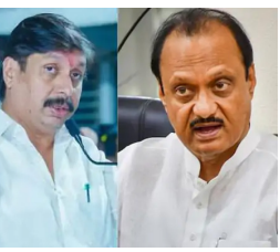
प्रथमच प्रसारमाध्यमांशी संवाद साधताना त्यांनी अजित पवार यांच्या राष्ट्रवादीसोबतच्या संभाव्य आघाडीबाबत आपली भूमिका स्पष्ट केली. पुणे आणि पिंपरी-चिंचवडमध्ये दोन्ही राष्ट्रवादी एकत्र आल्याच्या पार्श्वभूमीवर राज्यभर शरद पवार आणि अजित पवार