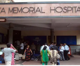
यासंबंधीच्या माहितीनुसार, मुंबईतील टाटा मेमोरियल रुग्णालयाला सोमवारी सकाळी धमकीचा ईमेल प्राप्त झाला. या ईमेलमध्ये रुग्णालयाच्या परिसरात बॉम्ब ठेवण्यात आल्याचा दावा करण्यात आला होता. हा ईमेल मिळताच रुग्णालय प्रशासनाने तातडीने मुंबई पोलिसांना माहिती दिली. त्यानंतर मुंबई पोलिस व बॉम्बनाशक पथक तातडीने घटनास्थळी दाखल झाले.

मुंबई- गत काही दिवसांपासून मुंबईतील वेगवेगळ्या आस्थापनांना सातत्याने बॉम्ब ठेवल्याच्या धमक्या येत आहेत. त्यात आता टाटा मेमोरियल हॉस्पिटलची भर पडली आहे. टाटा मेमोरियल हॉस्पिटलच्या परिसरात बॉम्ब ठेवल्याचा इशारा देणारा एक ईमेल आज सकाळी रुग्णालय प्रशासनाला प्राप्त झाला. त्यानंतर परेले पोलिसांनी तत्काळ घटनास्थळी धाव घेऊन तपासणी सुरू केली. हा घटनाक्रम पाहून इथे उपचारासाठी आलेल्या रुग्णांसह परिसरात मोठी घबराट पसरली होती.