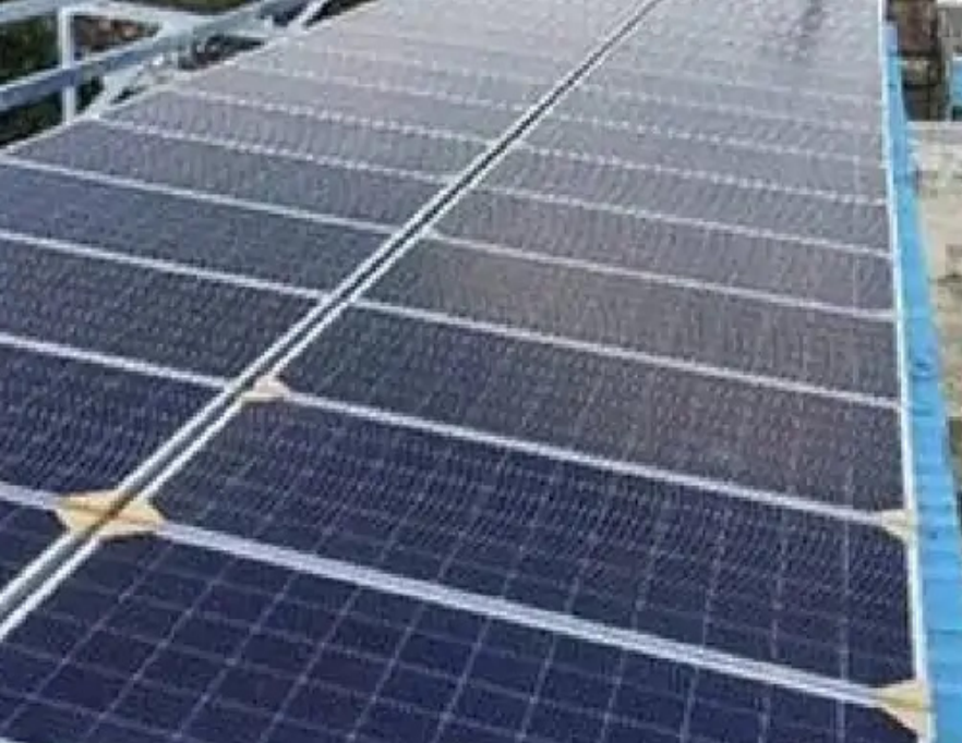
होल्टचा सफ़ाय लागतो. मोटर वीड मिनिटांसाठी सुरु असते. सौर पॅनल स्वच्छ झाल्यानंतर असे पेठे यांनी सांगितले. स्प्रिंकलर ऑटोमॅटिक बंद होते,

स्वच्छतेसाठी मोबाइलमध्ये फ्री अॅप पॅनल स्वच्छतेसाठी मोबाइलमध्ये फ्री अॅप दिले आहे. त्याद्वारे सौर पॅनलची स्वच्छता केली जाते. वायफायशी जोडलेले असाल तर कुठूनही घरावरील सौर पॅनलची स्वच्छता करता येते. या अॅपमध्ये फक्त डिजिट, फक्त पाणी आणि संपूर्ण स्वच्छता असे पर्याय दिले आहे. वायफाय सिस्टिम कनेक्टेड राहण्यासाठी हार्डवेअर तयार केले आहे. त्यात एक सॉफ्टवेअर प्रोग्रामिंग कोड दिले आहे. ते वायफायसोबत कनेक्ट राहिल. वायफाय सुरु असेल तर ५