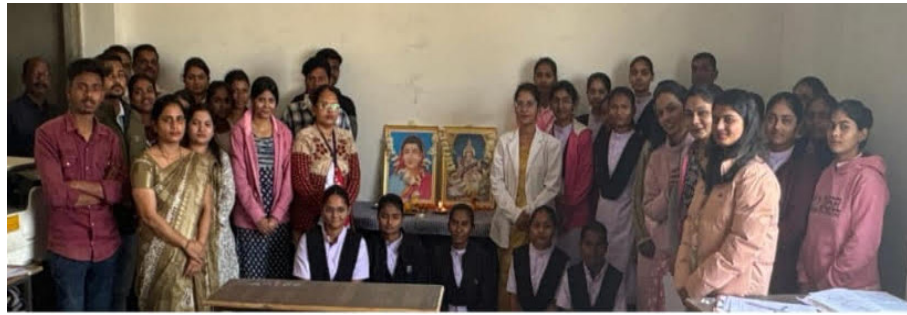
दिव्य वतन / तालुका प्रतिनिधी