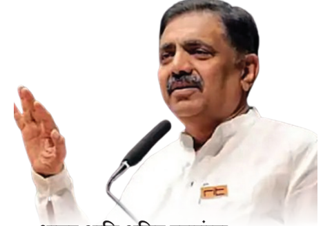
भाजप आणि अजित पवारांच्या राष्ट्रवादी वाद! (पान ८ वर)

नागपूर, अमरावती, चंद्रपूर, गडचिरोली, भंडारा, गोंदिया, वर्धा, यवतमाळ, अकोला, वाशीम, बुलडाणा, नांदेड, हिंगोली, परभणी, लातूर, धाराशिव, अहिल्यानगर, छ. संभाजीनगर, बीड, जालना, नंदुरबार, धुळे, नाशिक