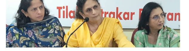
दिव्य वतन / जिल्हा प्रतिनिधी

नागपूर- गार्डन क्लबतर्फे १२३ वे वार्षिक फुलांचे प्रदर्शन आयोजित करण्यात आले आहे. हे प्रदर्शन (रविवारी ) दिनांक ११ जानेवारी रोजी कुसुमताई वानखेडे हॉल, नॉर्थ अंबाझरी रोड, नागपूर येथे सकाळी ११ वाजता. होणार आहे. या प्रदर्शनात निसर्गसौंदर्याची नेत्रदीपक मांडणी पाहायला मिळेल. गुलाब, गॅंढिओलाय, फुलांची सजावट, इनडोर रोपे, कॅक्टस व सुक्युलॅन्स, बोन्साय रोपे इत्यादींचा यात समावेश असेल.