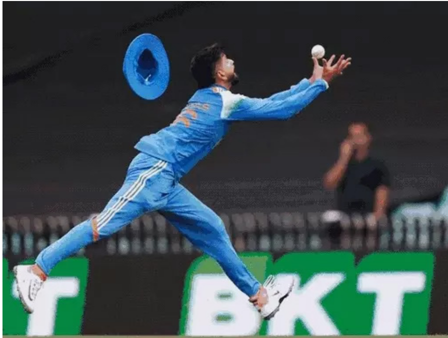
सिद्ध करायचा होता. अय्यरने एक दिवसापूर्वी विजय हजारे ट्रॉफीमध्ये मुंबईकडून हिमाचल प्रदेशविरुद्ध 82 धावांची खेळी करून आपला फिटनेस सिद्ध केला होता.

31 वर्षीय अय्यरला न्यूझीलंडविरुद्धच्या वनडे मालिकेसाठी संघात समाविष्ट करण्यात आले होते. पण, त्याला आपला मॅच फिटनेस सिद्ध करायचा होता. अय्यरने एक दिवसापूर्वी विजय हजारे ट्रॉफीमध्ये मुंबईकडून हिमाचल प्रदेशविरुद्ध 82 धावांची खेळी करून आपला फिटनेस सिद्ध केला होता.